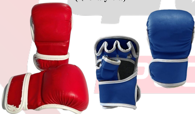
Перчатки для ММА с подушкой (от 6 унций) (цвета угла)