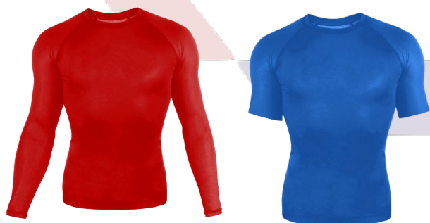
Рашгارد (цвета угла)