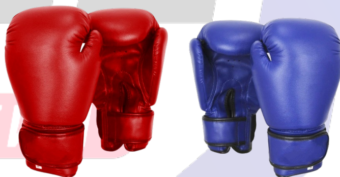
Перчатки для бокса (от 10 унций) (цвета угла)