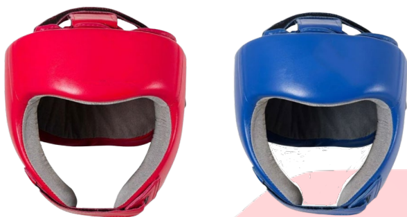
Открытый шлем (цвета угла)