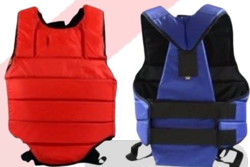
Защита корпуса (до 12 лет) (любого цвета)